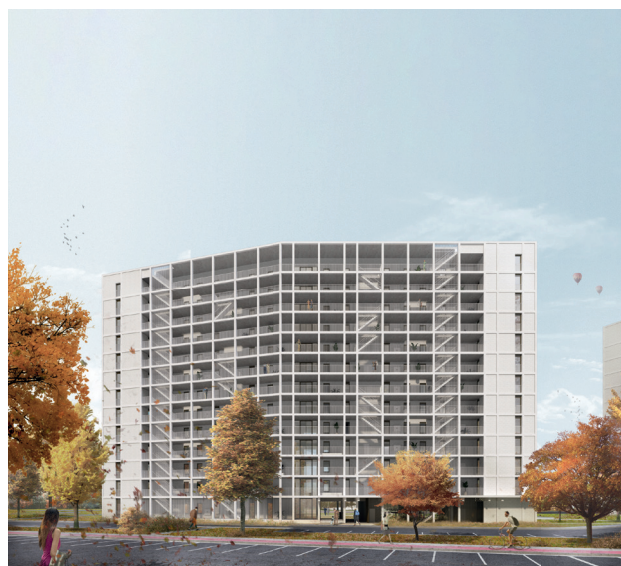
Schetsontwerp voorgevel aan de straatzijde