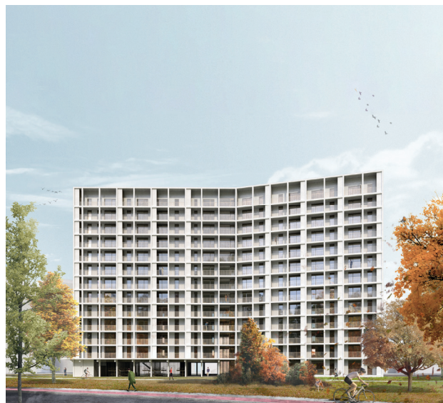
Schetsontwerp voorgevel aan de straatzijde

Het gebouw heeft een centrale onderdoorgang, die zowel zorgt voor toegang vanuit de stad als vanuit het park. Het nieuwe gebouw is ontworpen als een gebouw dat rust uitstraalt, privacy biedt maar ook aanzet tot ontmoeting.