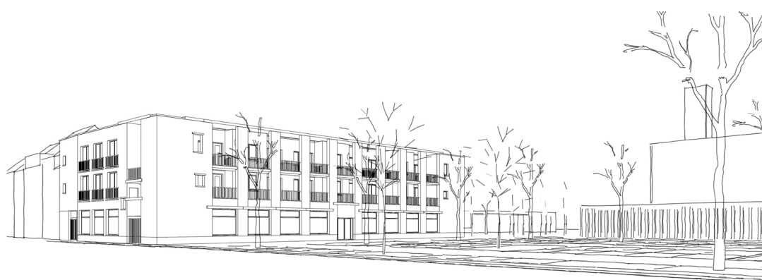
Simulatie appartementsgebouw en sociaal restaurant IKOOK

Op 16 oktober 2023 gaan de werken aan de nieuwe sociale woningen en het wijkrestaurant van start. Als de werken volgens plan verlopen, zal het gebouw in het voorjaar van 2025 klaar zijn.