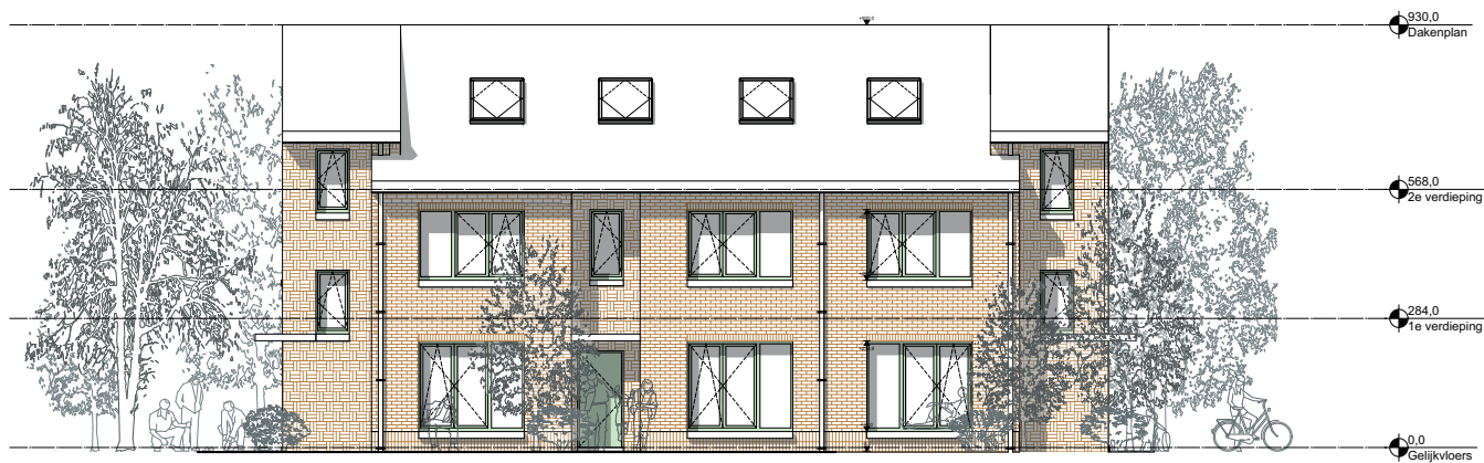
Schetsontwerp: Voorgevel 3 woningen